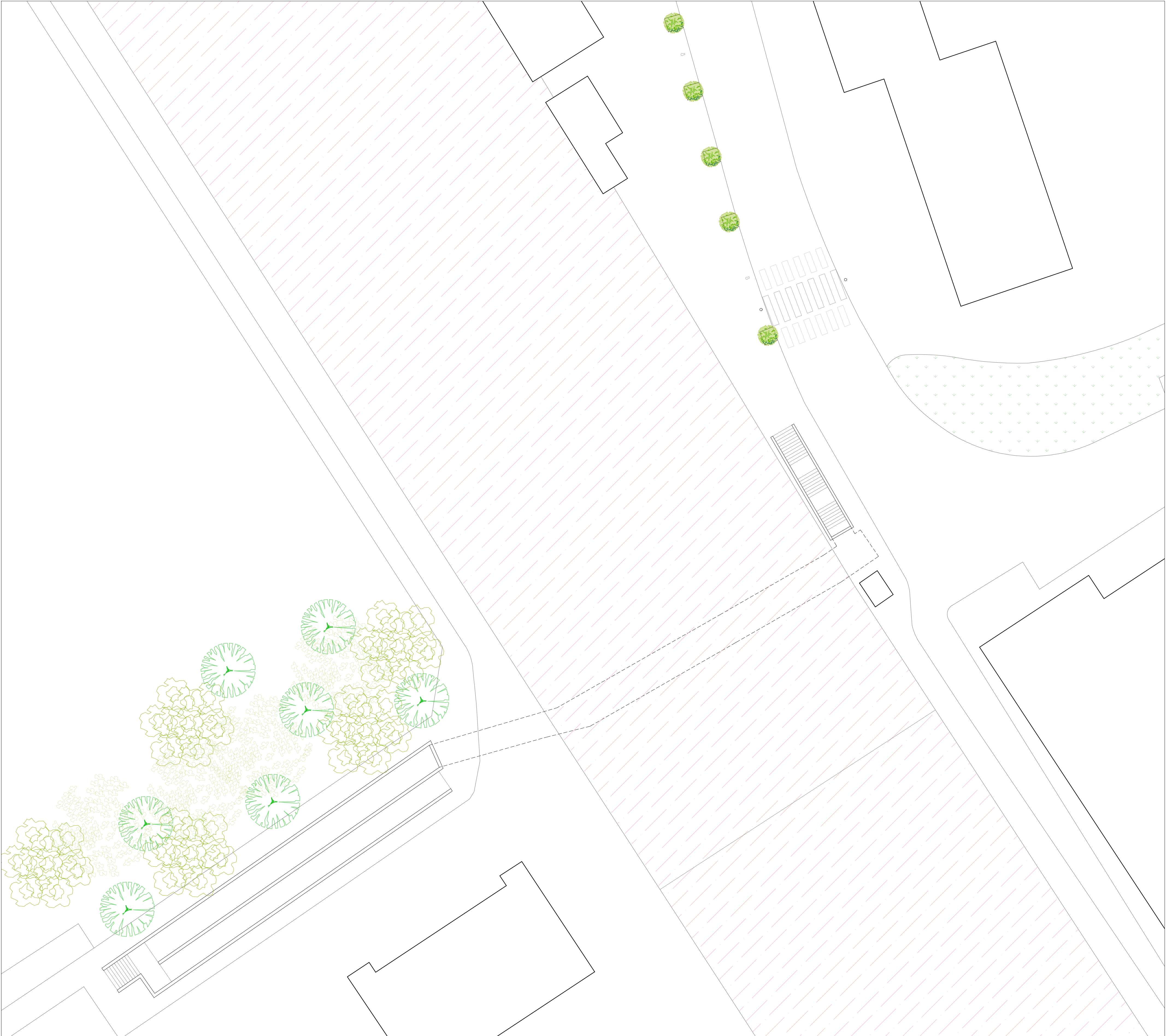
MASTERPLAN - scala 1:200